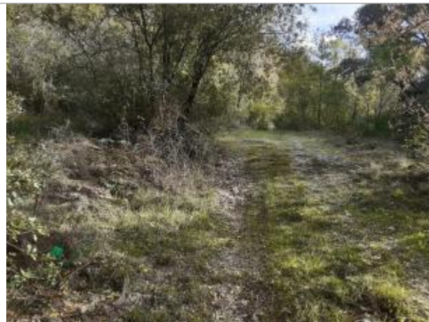
Vue du site, photo OTEIS