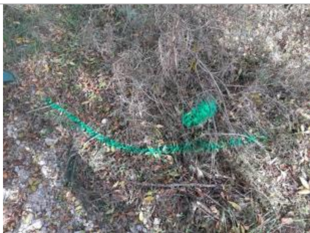
Vue du repère, photo OTEIS