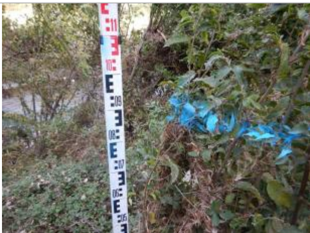
Vue du repère, photo OTEIS

Altitude calculée de l'eau (en m) : 146.924 m