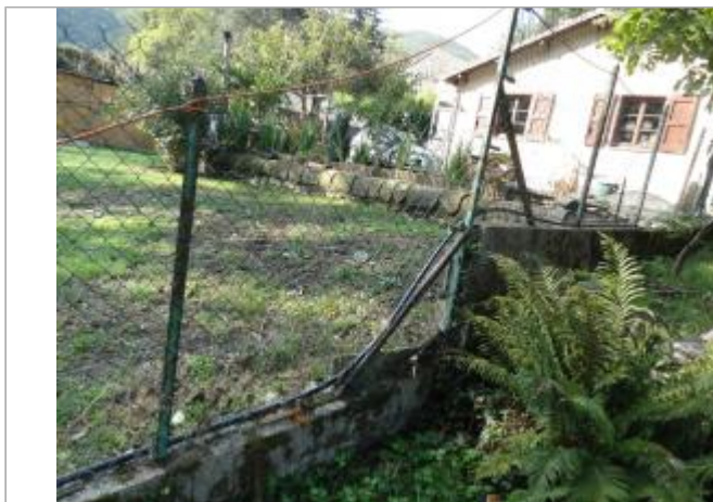
Vue du site, photo OTEIS

Coordonnées WGS84 : X: 3.64343620 / Y: 44.08279970