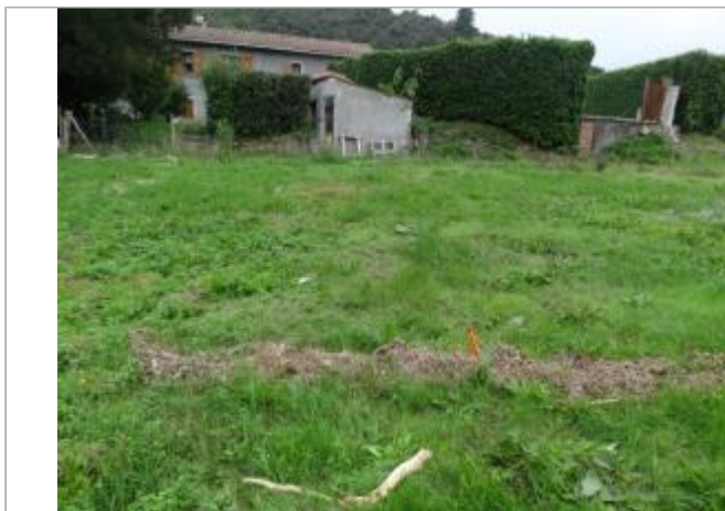
Vue du site, photo OTEIS

Coordonnées WGS84 : X: 3.67681030 / Y: 44.00068230