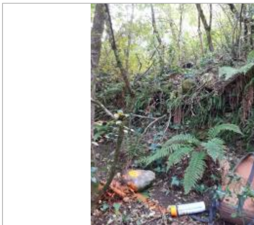
Vue du site, photo OTEIS