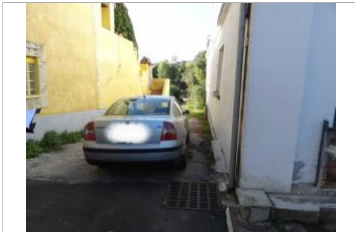
Vue du site, photo OTEIS