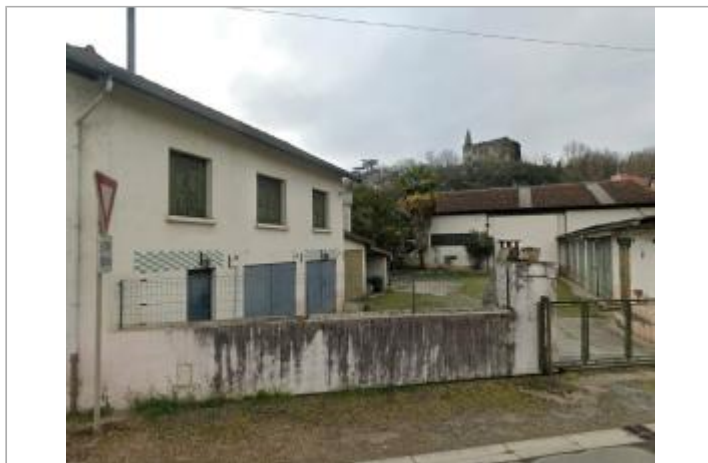
Garage situé au 17 rue des Soupirs