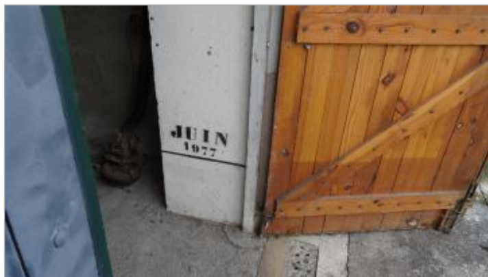
Trait de peinture indiquant la hauteur d'eau atteinte par la crue du 19 mai 1977 (mention "juin" erronée)