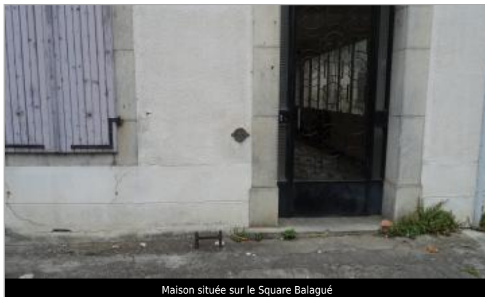
Maison située sur le Square Balagué