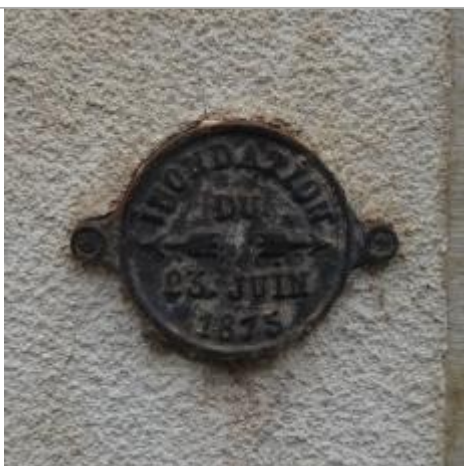
Plaque en fonte marquant le niveau d'eau atteint par la crue du 23 juin 1875 (PHEC)