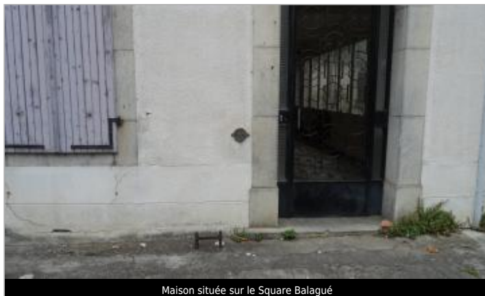
Maison située sur le Square Balagué

Coordonnées WGS84 : X: 1.14274938 / Y: 42.98628710