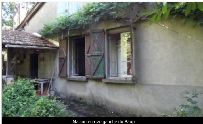
Maison en rive gauche du Baup