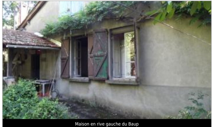
Maison en rive gauche du Baup