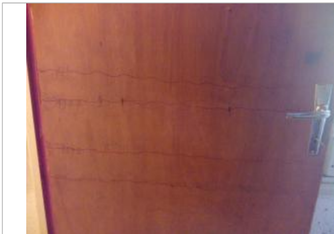
Trait au crayon marquant la PHE de la crue du 05/10/1992.