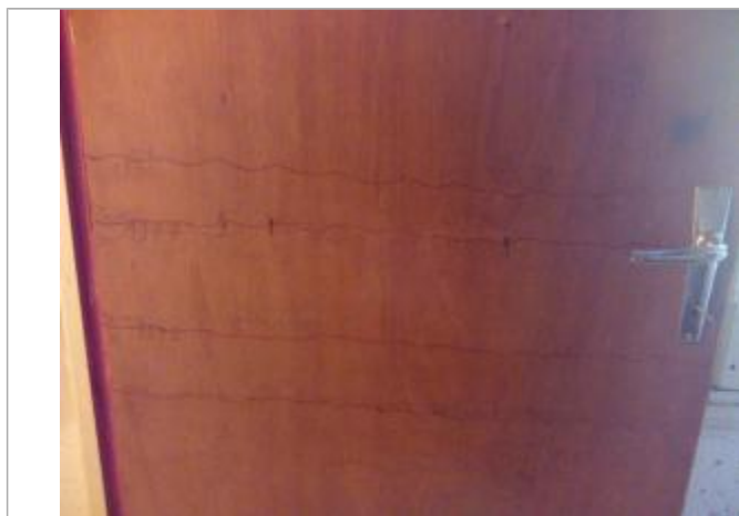
Trait au crayon marquant la PHE de la crue du 19/05/1977