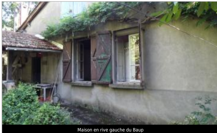
Maison en rive gauche du Baup