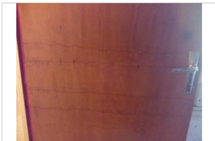
Trait au crayon marquant la PHE de la crue du 19/05/1977