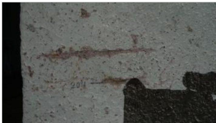
Trait au crayon et gravure grossière reportant la PHE de la crue du 07 novembre 2011.