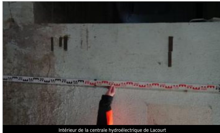
Intérieur de la centrale hydroélectrique de Lacourt