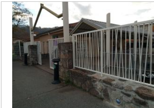
Muret de l'enceinte de l'établissement scolaire à côté de l'entrée principale

Coordonnées WGS84 : X: 1.15063911 / Y: 42.97779590