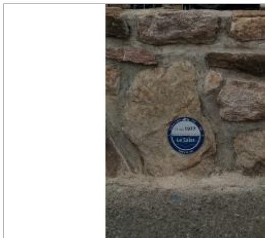
Macaron reportant le niveau de la crue du 19/05/1977