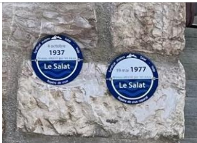
Macaron reportant le niveau de la crue du 04/10/1937