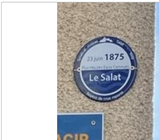
Macaron reportant le niveau de la crue du 23/06/1875 (PHEC)