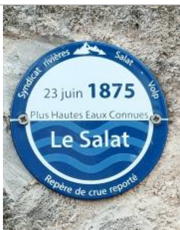
Macaron reportant le niveau de la crue du 23/06/1875 (PHEC)