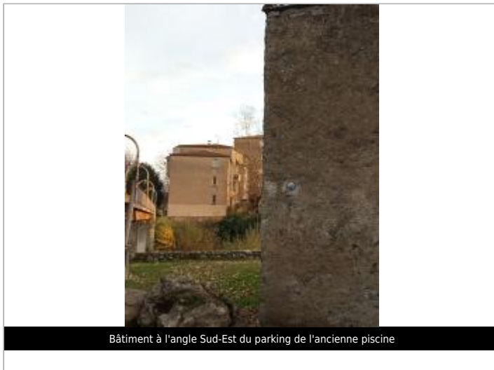
Bâtiment à l'angle Sud-Est du parking de l'ancienne piscine