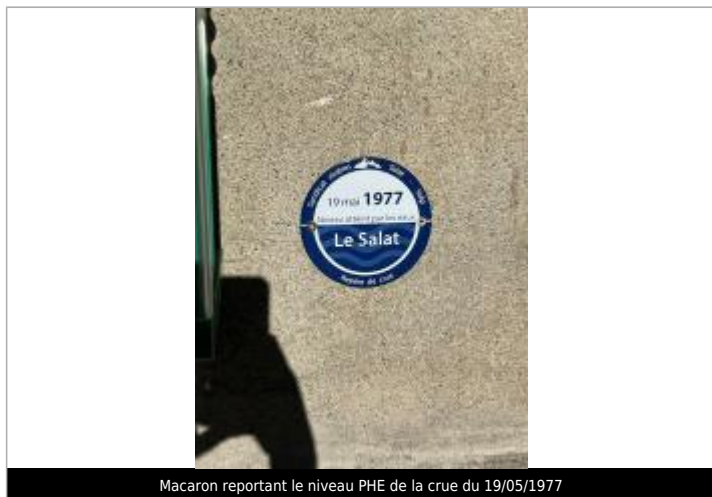
Macaron reportant le niveau PHE de la crue du 19/05/1977