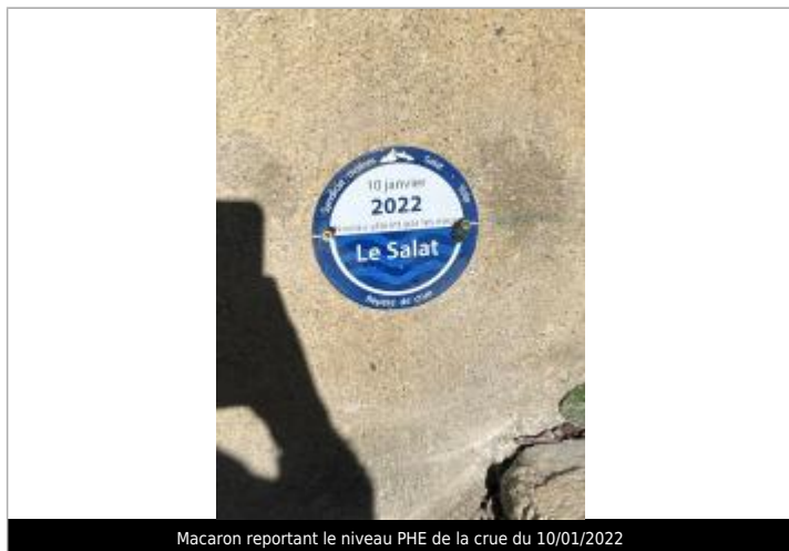
Macaron reportant le niveau PHE de la crue du 10/01/2022