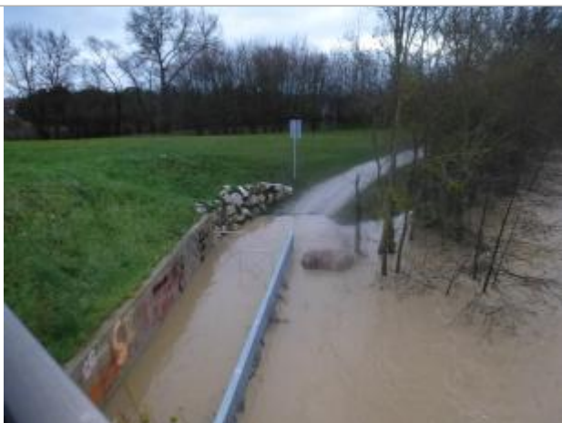
Le Touch envahit le chemin sous le pont