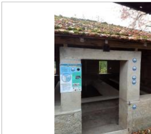
Façade de l'entrée du lavoir de Lacave