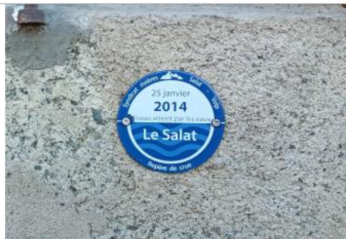
Macaron reportant la PHE de la crue du 25/01/2014