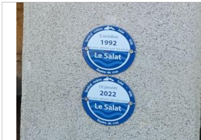
Macaron reportant la PHE de la crue du 05/10/1992