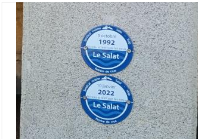
Macaron reportant la PHE de la crue du 05/10/1992