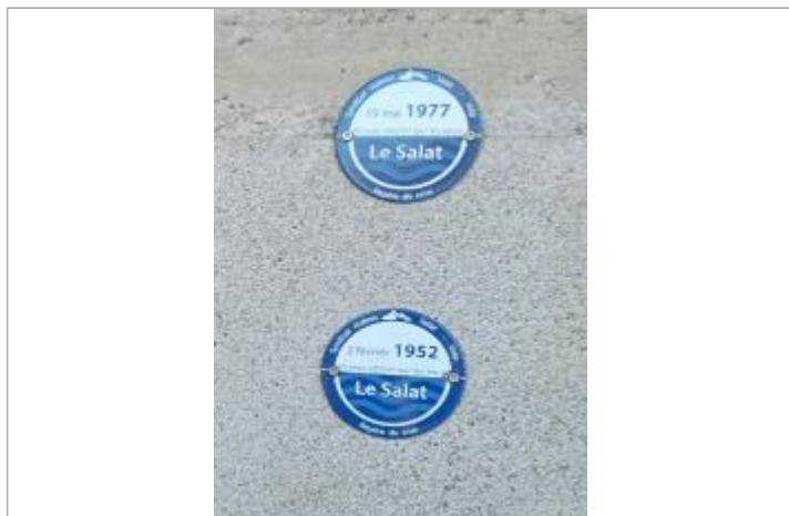
Macaron reportant la PHE de la crue du 19/05/1977