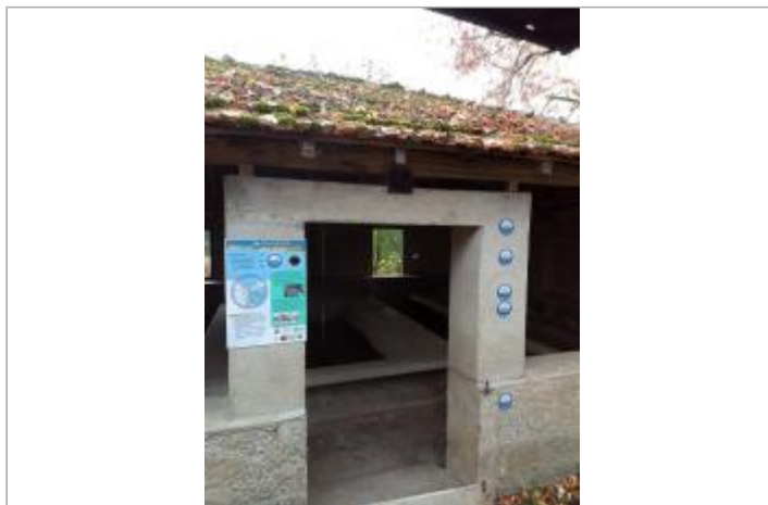
Façade de l'entrée du lavoir de Lacave