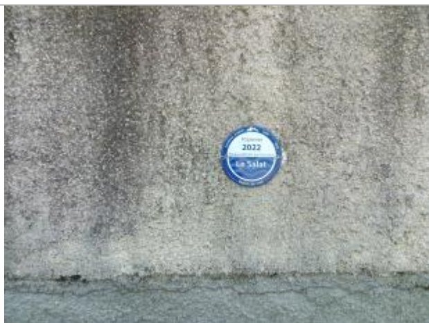
Macaron PHE reportée de la crue du 10 janvier 2022

Altitude calculée de l'eau (en m) : 290.09