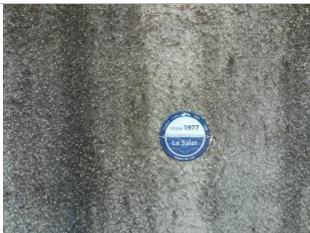
Macaron PHE reportée de la crue du 19 mai 1977

Altitude calculée de l'eau (en m) : 290.48