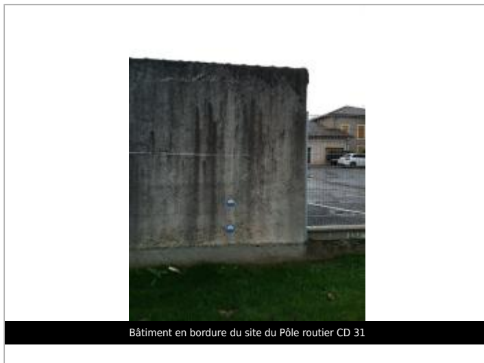
Bâtiment en bordure du site du Pôle routier CD 31