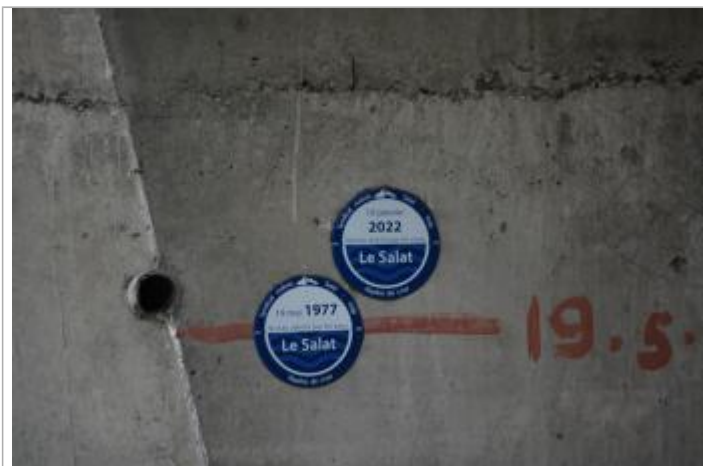
Macaron PHE reportée de la crue du 19 mai 1977