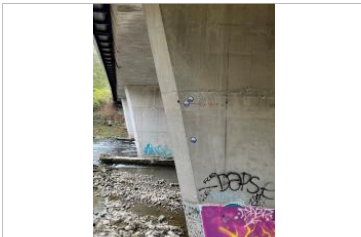
Pile du pont autoroutier de l'A64 sur le Salat