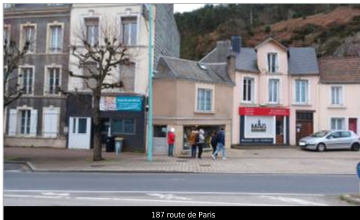
187 route de Paris