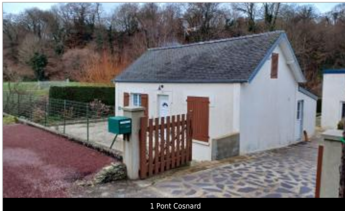
1 Pont Cosnard