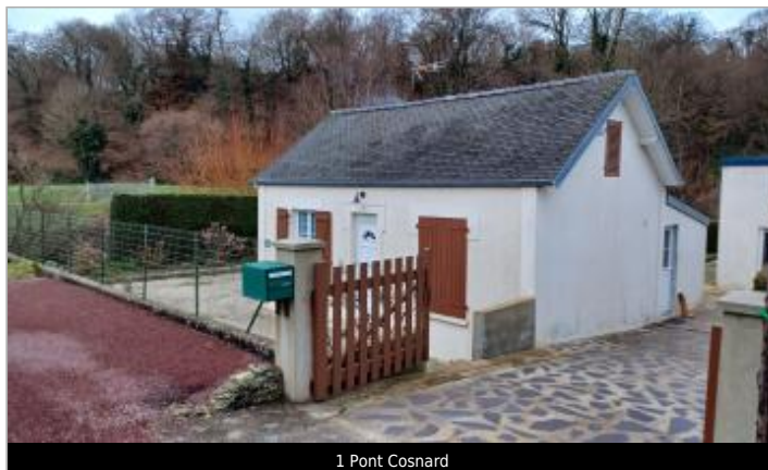
1 Pont Cosnard