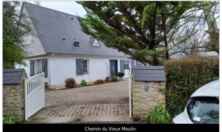
Chemin du Vieux Moulin.