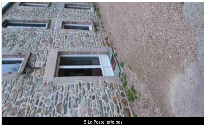
5 La Postellerie bas.