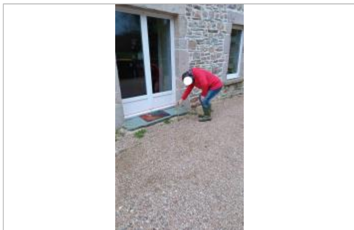
Laisse de crue à 15 cm/sol

SOURCE DE REPÉRAGE : VISITE DE TERRAIN SPC SACN - 11/03/2020