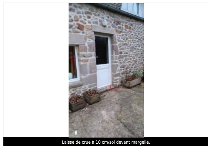
Laisse de crue à 10 cm/sol devant margelle.