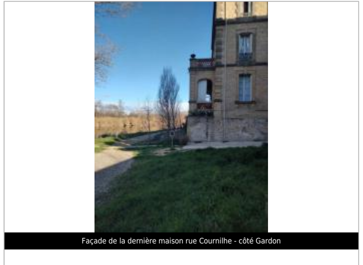
Façade de la dernière maison rue Cournilhe - côté Gardon