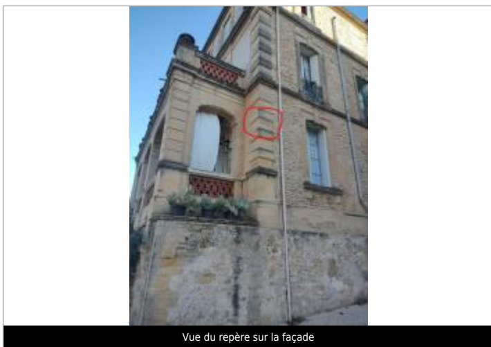
Vue du repère sur la façade

Texte : 1-10-1958 Maximum de l'inondation : Oui Visibilité : Oui État du repère : Bon Pérennité : Longue