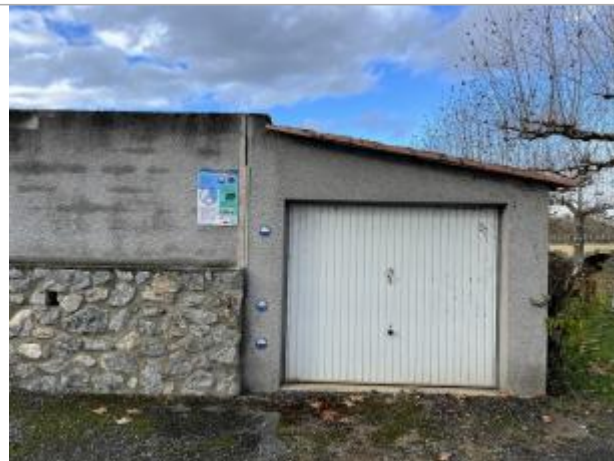
Garage à l'angle Sud-Est du cimetière