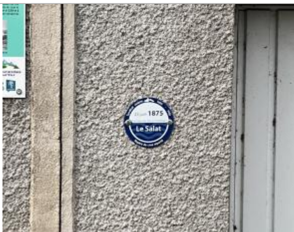
Macaron reporté PHEC 23 juin 1875