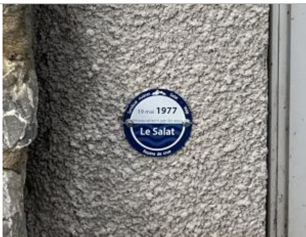
Macaron reporté PHE du 19 mai 1977