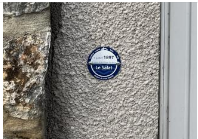
Macaron reporté PHE 3 juillet 1897

Altitude calculée de l'eau (en m) : 302.15