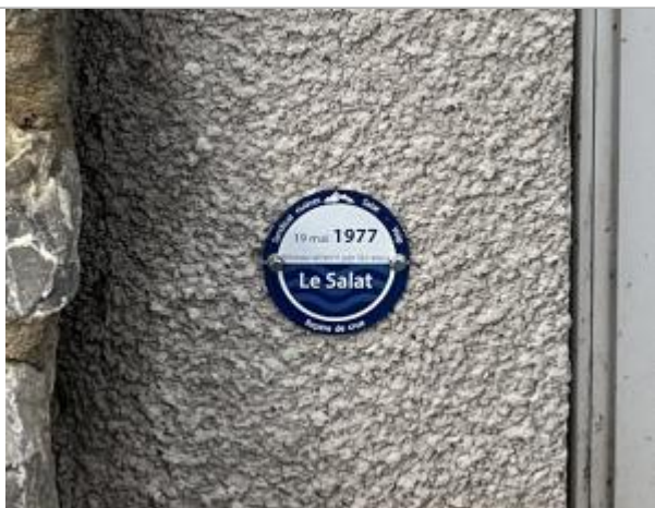
Macaron reporté PHE du 19 mai 1977