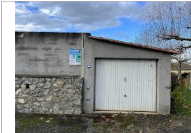
Garage à l'angle Sud-Est du cimetière