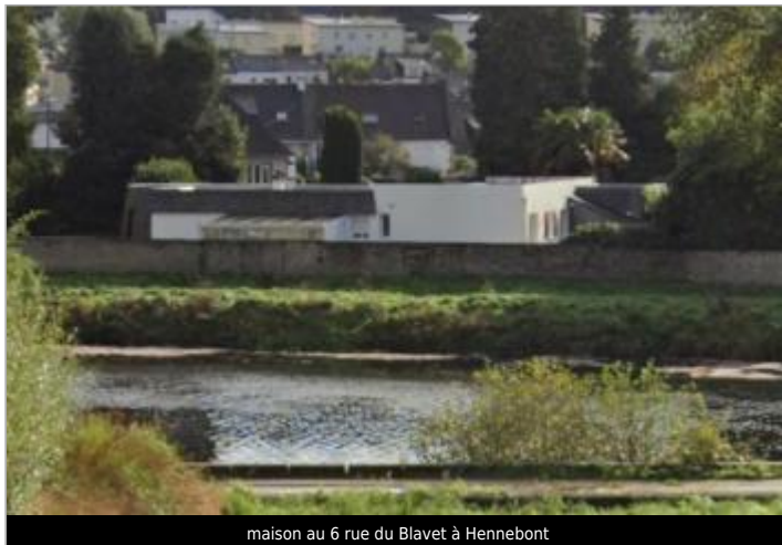
maison au 6 rue du Blavet à Hennebont