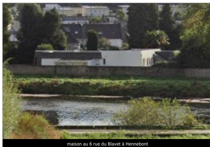
maison au 6 rue du Blavet à Hennebont

GÉOLOCALISATION Coordonnées WGS84 : X: -3.25074041 / Y: 47.82460250 Coordonnées RGF93 (Lambert 93) X: 232767.88 / Y: 6765637.11 Coordonnées RGF93 (ETRS89) : X: -3.2507404 / Y: 47.8246025 Code Hydro: J5--0210 Rive de référence: Gauche