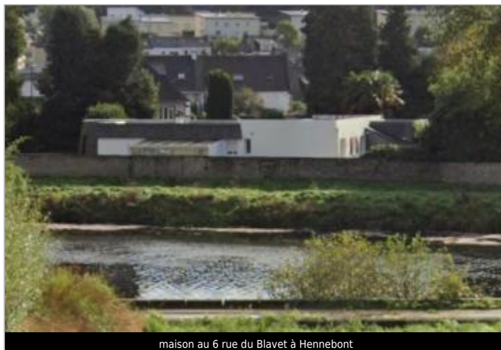
maison au 6 rue du Blavet à Hennebont