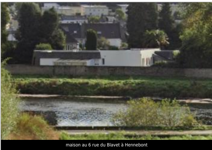
maison au 6 rue du Blavet à Hennebont

GÉOLOCALISATION Coordonnées WGS84 : X: -3.25074041 / Y: 47.82460250 Coordonnées RGF93 (Lambert 93) X: 232767.88 / Y: 6765637.11 Coordonnées RGF93 (ETRS89) : X: -3.2507404 / Y: 47.8246025 Code Hydro: J5--0210 Rive de référence: Gauche