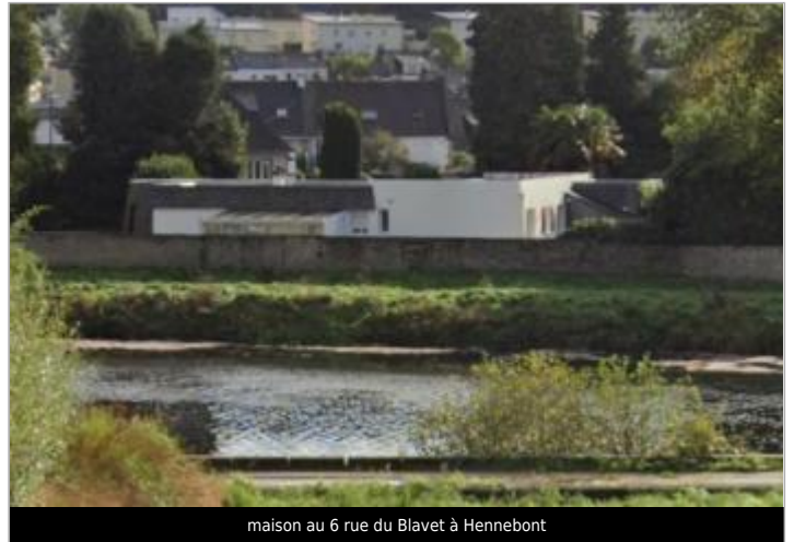
maison au 6 rue du Blavet à Hennebont

GÉOLOCALISATION Coordonnées WGS84 : X: -3.25074041 / Y: 47.82460250 Coordonnées RGF93 (Lambert 93) X: 232767.88 / Y: 6765637.11 Coordonnées RGF93 (ETRS89) : X: -3.2507404 / Y: 47.8246025 Code Hydro: J5--0210 Rive de référence: Gauche