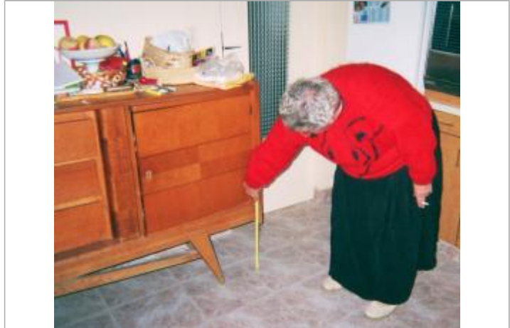
intérieur maison au 6 rue du Blavet à Hennebont

MARQUE Maximum de l'inondation : Oui Visibilité : Non État du repère : Bon Pérennité : Longue Repère calculé : Non PHEC : Non