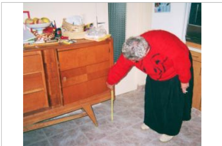
intérieur de la maison au 6 rue du Blavet à Hennebont

GÉNÉRAL Code : 56083_RH2_HENN_2001 Date de mise à jour : 26/01/2023 Auteur : SPC VCB