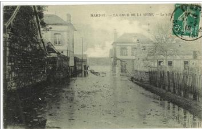
Carte Postale crue de la Seine

RELÈVE DU NIVEAU ATTEINT D'APRÈS LA PHOTO À L'AIDE DE MATÉRIEL DE GÉOMÈTRE, EN COLLABORATION AVEC LE SPC SEINE AVAL CÔTIERS NORMANDS - 10/07/2023