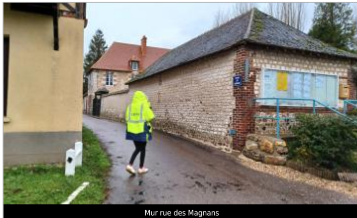
Mur rue des Magnans