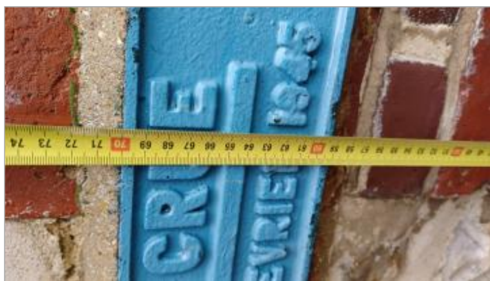
Plaque crue 1945

Altitude calculée de l'eau (en m) : 11.3 m