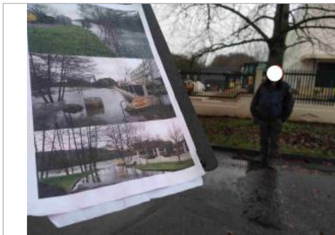
Sol de la voie verte

Coordonnées WGS84 : X: 1.17732948 / Y: 49.22398690