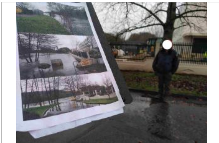
Sol de la voie verte