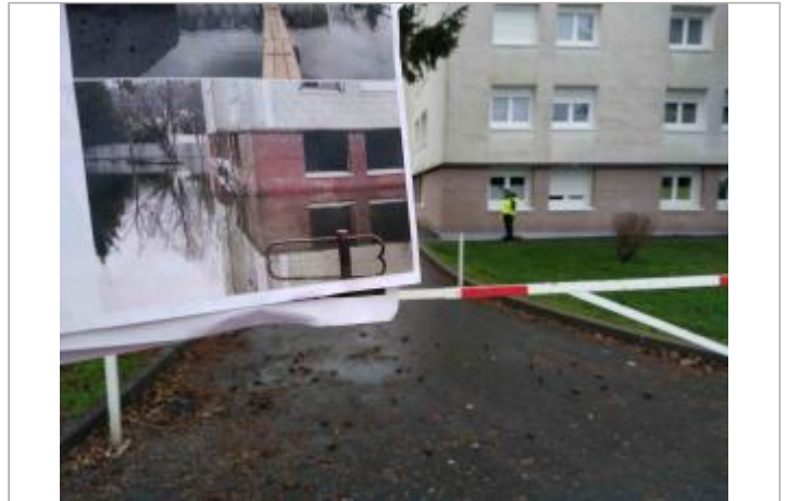
Façade de l'immeuble.