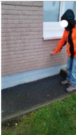
Laisse de crue à 67 cm/sol.

Altitude calculée de l'eau (en m) : 16.2897 m