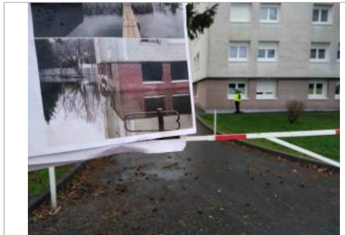
Façade de l'immeuble.

Coordonnées WGS84 : X: 1.18289768 / Y: 49.20647220