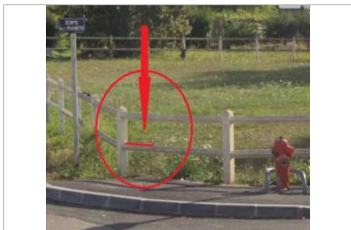
Haut de la lisse

Altitude calculée de l'eau (en m) : 16.13