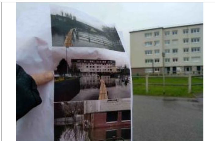
Vue de la barrière