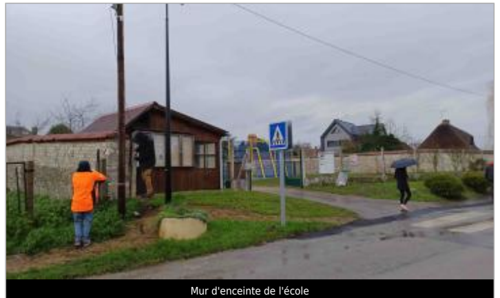
Mur d'enceinte de l'école

Coordonnées WGS84 : X: 1.37550067 / Y: 49.21754400