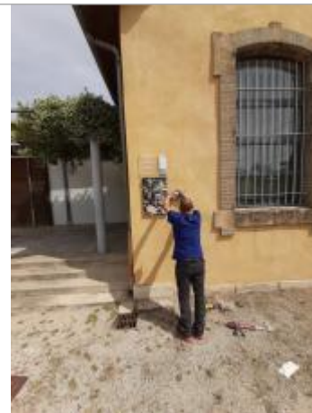
Espace Guy Chevalier bibliothèque

Coordonnées RGF93 (ETRS89) : X: 4.7032442 / Y: 44.0978879