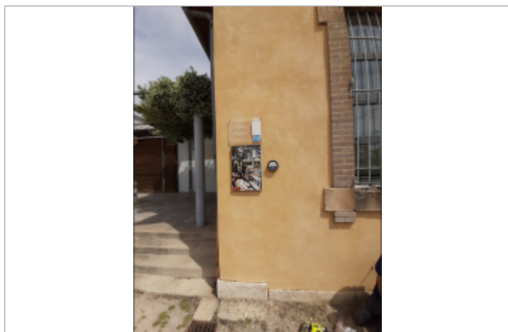
crue du Rhône