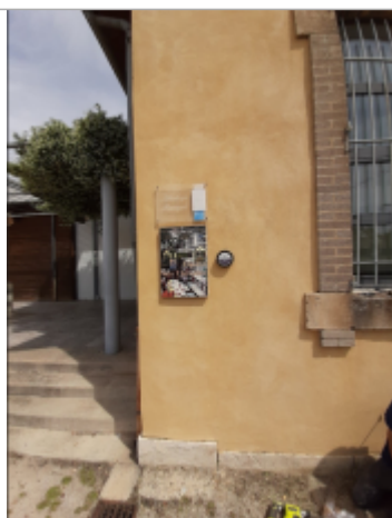
crue du Rhône