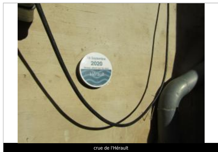
crue de l'Hérault