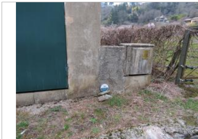
Moulin de Serviel Sumène