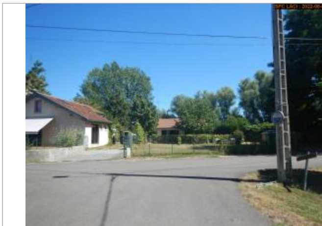
Vue du site éloignée