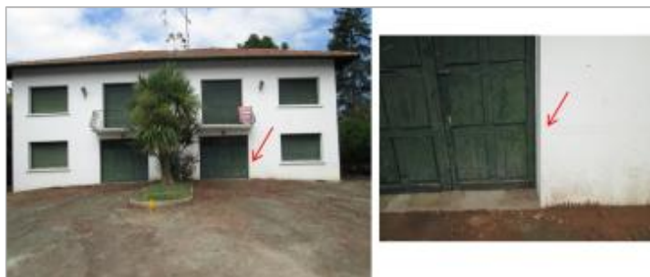
Vue de la laisse - auteur : HYDRATEC