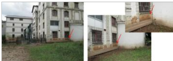
Vue de la laisse - auteur : HYDRATEC