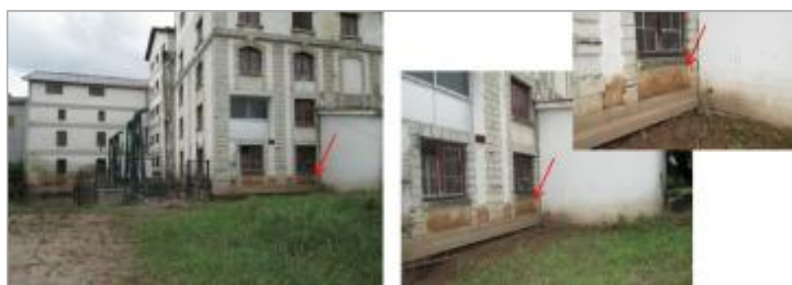
Vue de la laisse - auteur : HYDRATEC